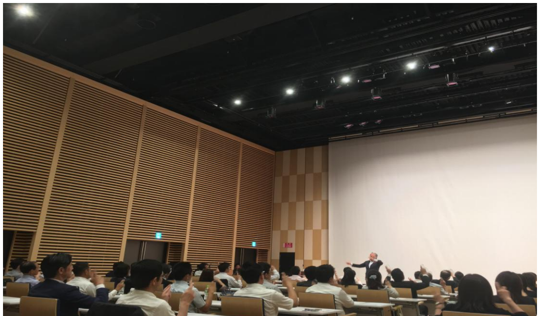
【手話でがんの子どもたちを思って作った歌を披露】