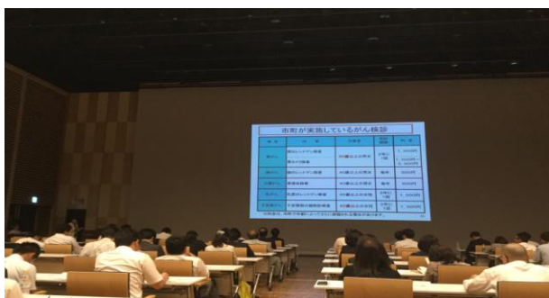
【福井県健康増進課からの がんの最新情報の提供】