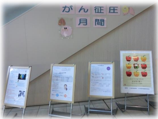
(パネル展示の様子)